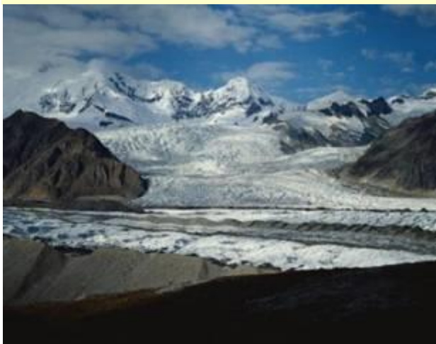
Gletsjer in de Himalaya

Volgens het IPCC zullen in het jaar 2035 alle gletsjers in de Himalaya verdwenen zijn . Wetenschappelijk onderzoek zou ondubbelzinnig aantonen dat de gletsjers van dit gebergte in een moordend tempo aan het smelten zijn. Maar ook hier zit het VN-Klimaatpanel er volkomen naast want de in werkelijkheid krimpen deze ijsmassa's namelijk helemaal niet meer. De klimaatwetenschappers van dit panel beroepen zich op een verkeerd persbericht van het Wereld natuur Fonds overgenomen van een Russische studie. Een glacioloog ontdekte dat de voorspelling het jaar 2350 betrof. Iemand verwisselde bij het typen de 0 de 3 en de 5. Op dit niveau werken sommige klimaatalarmisten. De ene na de andere mythe wordt ontmaskerd. De Indiase geoloog en glacioloog Kumar Raina stelde begin 2009 dat de informatie van het IPCC over het smelten van de gletsjers niet klopte, maar kreeg ogenblikkelijk een felle aanval van IPCC-topman Rajendra Pachauri te verduren. Raina deed een diepgaande studie naar de ontwikkeling van gletsjers in het Himalaya gebergte en ontdekte dat de afkalving reeds in 2007 tot stilstand is gekomen.