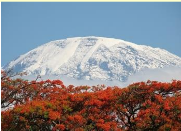
Sneeuw op de Kilimanjaro (2018)

Zo gebruikt hij de filmbeelden van de orkaan Katrina en suggereert dat deze een gevolg is van de opwarming. Gore verspelde ook dat de sneeuw op de Kilimanjaro (de hoogste berg van Afrika) “binnen een decennium” zou smelten. Maar heden ten dage ligt er meer sneeuw op de Kilimanjaro dan ooit tevoren. De grootste sneeuwval is gemeten in 2018.