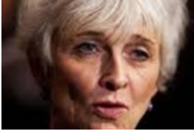
De Nederlandse milieuminister Jacqueline Cramer (PvdA).

De linkse klik heeft de 'opwarming van de aarde' nodig om de argeloze burger een serie nieuwe belastingen aan te smeren om ze zo te laten bloeden 'omdat de aarde zogenaamd gered moet worden.' Talloze miljarden vallen op deze manier in handen